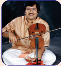
ವಿದ್ವಾನ್ ಮತ್ತೂರು ಶ್ರೀನಿಧಿ ವಯಲಿನ್