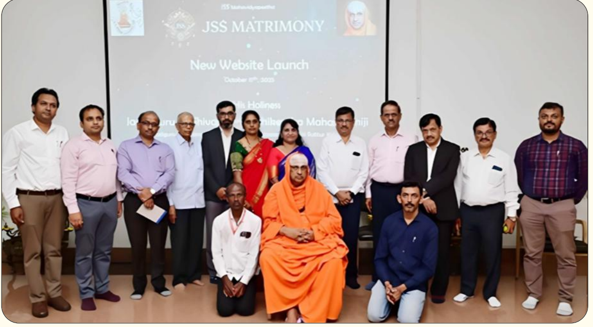
ಮೈಸೂರಿನ ಜೆಎಸ್‌ಎಸ್ ಆಸ್ಪತ್ರೆಯ ಶ್ರೀ ರಾಜೇಂದ್ರ ಶತಮಾನೋತ್ಸವ ಸಭಾಂಗಣದ ಗ್ಯಾಲರಿಯಲ್ಲಿ ಪರಮಪೂಜ್ಯ ಜಗದ್ಗುರುಗಳವರ ದಿವ್ಯ ಸಾನ್ನಿಧ್ಯದಲ್ಲಿ ಜೆಎಸ್‌ಎಸ್ ವಿವಾಹವೇದಿಕೆಯ ನವೀಕೃತ ವೆಬ್‌ಸೈಟ್‌ನ್ನು ಅನಾವರಣಗೊಳಿಸಲಾಯಿತು. ಆ ಸಂದರ್ಭದಲ್ಲಿ ಮಹಾವಿದ್ಯಾಪೀಠದ ಅಧಿಕಾರಿಗಳು ಹಾಗೂ ವೆಬ್‌ಸೈಟ್ ಸಿದ್ಧಪಡಿಸಿದ ತಂಡದವರು ಉಪಸ್ಥಿತರಿದ್ದರು (17 ಅಕ್ಟೋಬರ್ 2025)