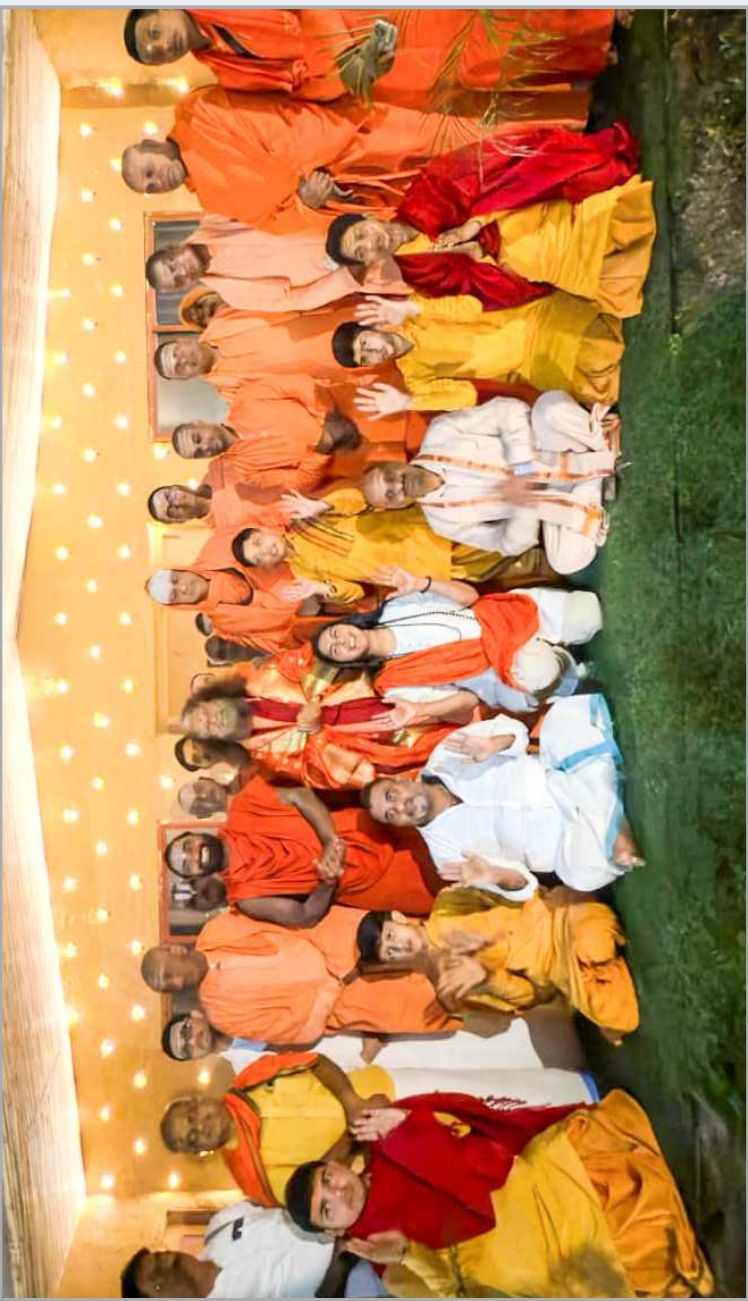
ಪ್ರಯಾಗ್‌ರಾಜ್ ಮಹಾಕುಂಭಮೇಳದಲ್ಲಿ ಪರಮಾರ್ಥ ನಿಕೇಶನ ಅಶ್ರಮದಲ್ಲಿ ಶ್ರೀ ಚಿದಾನಂದ ಸರಸ್ವತಿಯವರು, ಪರಮಪೂಜ್ಯ ಜಗದ್ಗುರುಗಳು, ವಿವಿಧ ಮಠಾಧೀಶರುಗಳು ಹಾಗೂ ಇತರರಿದ್ದಾರೆ (3 ಫೆಬ್ರವರಿ 2025)