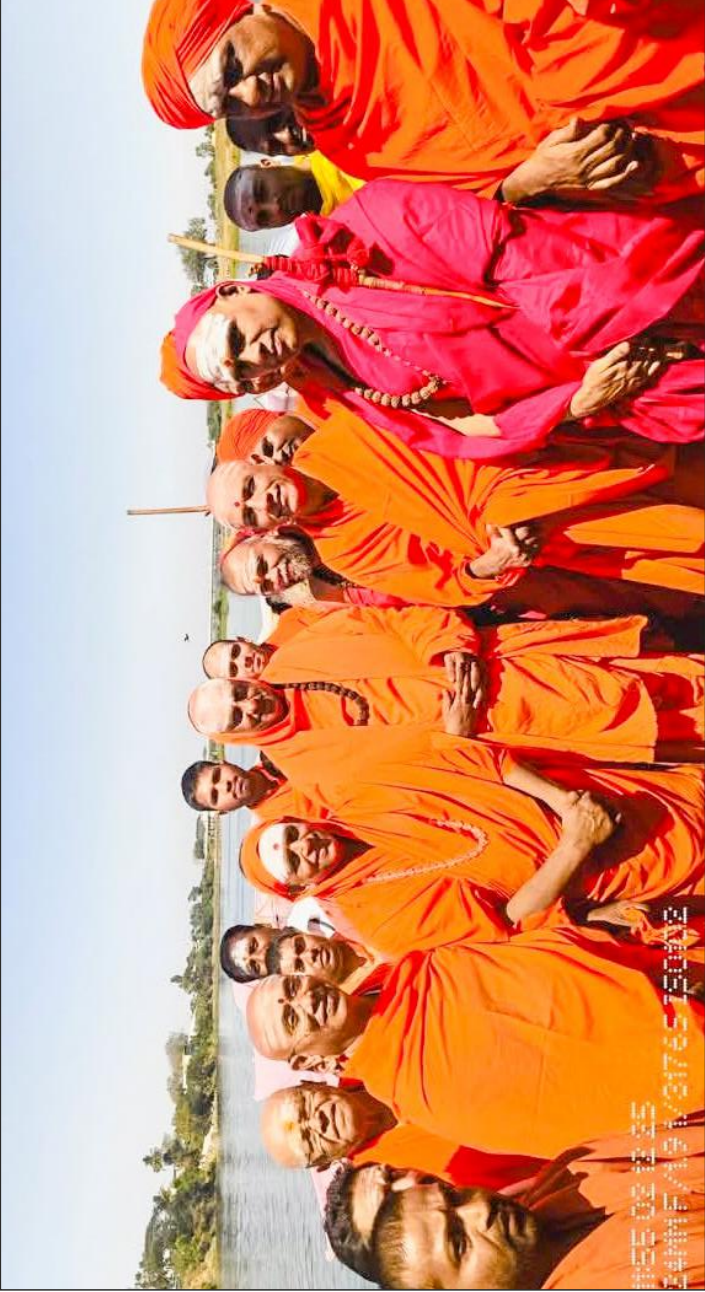
ತಿರುಮಕೂಡಲು ನರಸೀಪುರದಲ್ಲಿ ನಡೆದ 13ನೇ ಕುಂಭಮೇಳದಲ್ಲಿ ಪರಮಪೂಜ್ಯ ಜಗದ್ಗುರುಗಳವರೊಂದಿಗೆ ಕೈಲಾಸಾಶ್ರಮ, ಹರಿಹರಪುರ, ಆದಿಹುಂಚನಗಿರಿ, ಅವದೂತ ದತ್ತ ಪೀಠದ ಪೂಜ್ಯರುಗಳು ಹಾಗೂ ವಿವಿಧ ಮಠಾಧೀಶರುಗಳಿದ್ದಾರೆ (10 ಫೆಬ್ರವರಿ 2025)