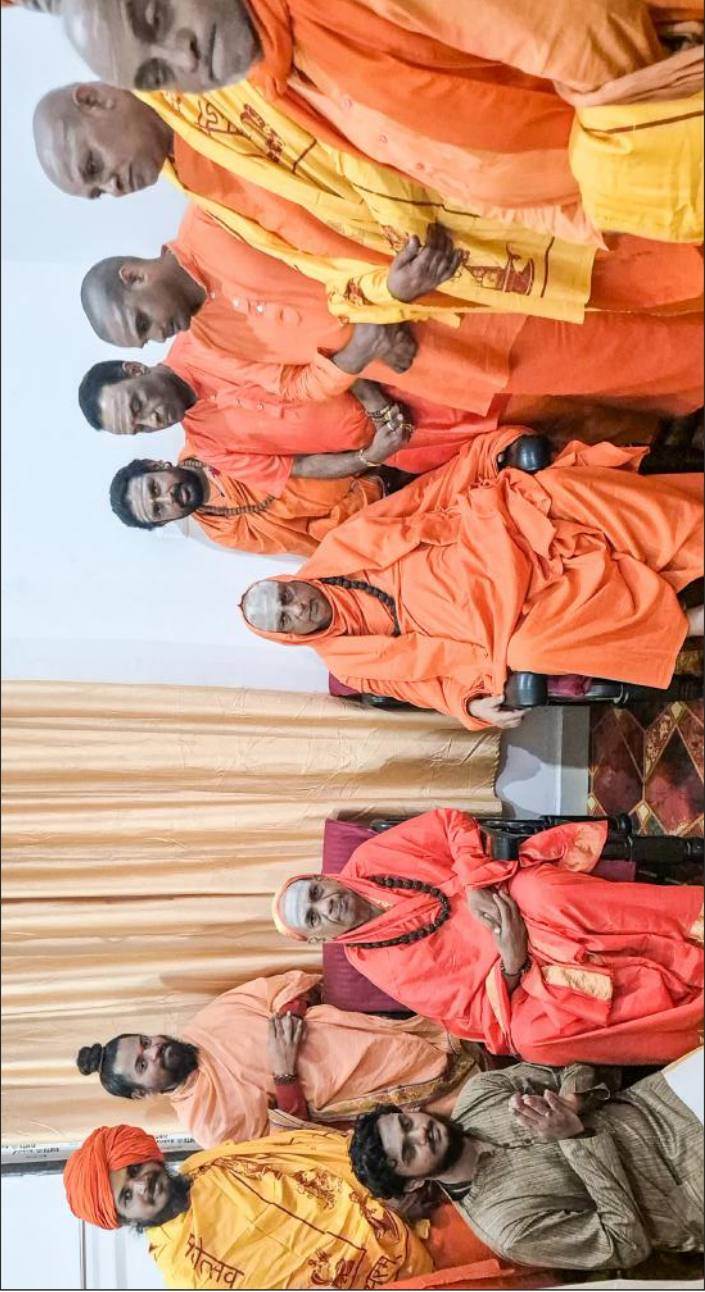
ಸುತೂರು ಶ್ರೀಗಳು ಪ್ರಯಾಗ್‌ರಾಜ್‌ನಲ್ಲಿ ಮಹಾಕುಂಭಮೇಳಕ್ಕೆ ತೆರಳಿದ್ದಾಗ ಅಲ್ಲಿಯ ಶ್ರೀ ಕಾಶಿ ಜಂಗಮವಾಡಿ ಮಠಕ್ಕೆ ಭೇಟಿ ನೀಡಿದ್ದರು. ಕಾಶಿ ಮತ್ತು ಸುತೂರು ಜಗದ್ಗುರುಗಳವರು, ವಿವಿಧ ಮಠಾಧೀಶರುಗಳು ಹಾಗೂ ಇತರರಿದ್ದಾರೆ (3 ಫೆಬ್ರವರಿ 2025)