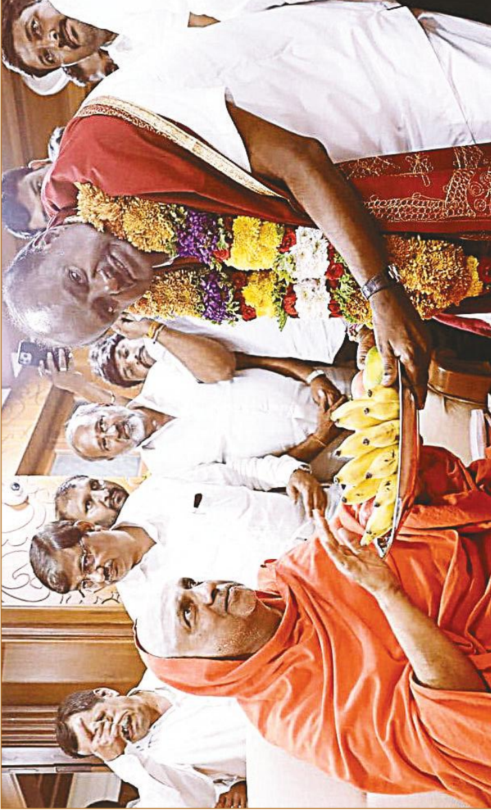
ಮೈಸೂರು ಶ್ರೀ ಸುತ್ತೂರು ಮಠಕ್ಕೆ ಕೇಂದ್ರದ ಸಚಿವರಾದ ಶ್ರೀ ಹೆಚ್.ಡಿ. ಕುಮಾರಸ್ವಾಮಿಯವರು ಭೇಟಿ ನೀಡಿದ ಸಂದರ್ಭದಲ್ಲಿ ಪರಮಪೂಜ್ಯ ಜಗದ್ಗುರುಗಳವರು ಸನ್ಮಾನಿಸಿ ಆಶೀರ್ವದಿಸಿದರು (10 ಆಗಸ್ಟ್ 2024)