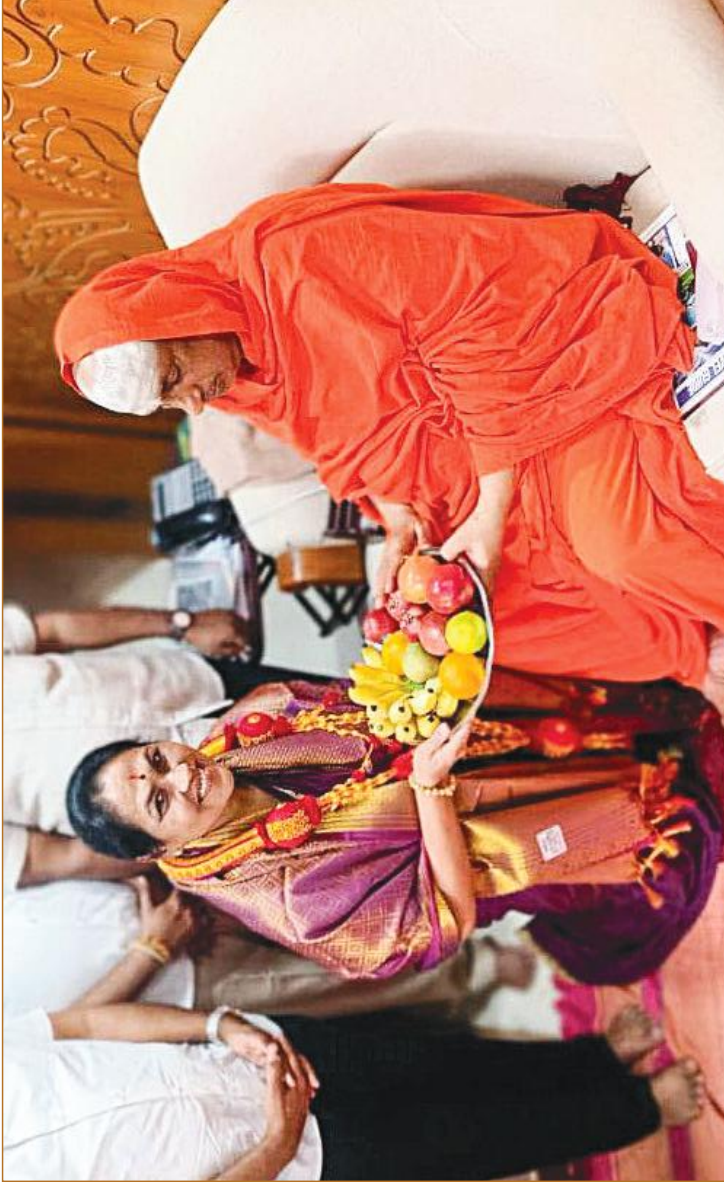
ಮೈಸೂರು ಶ್ರೀ ಸುತ್ತೂರು ಮಠಕ್ಕೆ ಕೇಂದ್ರದ ರಾಜ್ಯ ಸಚಿವರಾದ ಕು. ಶೋಭಾ ಕರಂದ್ಲಾಜೆಯವರು ಭೇಟಿ ನೀಡಿದ ಸಂದರ್ಭದಲ್ಲಿ ಪರಮಪೂಜ್ಯ ಜಗದ್ಗುರುಗಳವರು ಸನ್ಮಾನಿಸಿ ಆಶೀರ್ವದಿಸಿದರು (2 ಆಗಸ್ಟ್ 2024)