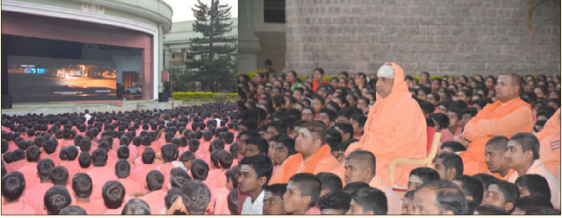
ಶ್ರೀ ಸುತ್ತೂರು ಕ್ಷೇತ್ರದಲ್ಲಿ ವಸತಿ ಶಾಲೆಯ ವಿದ್ಯಾರ್ಥಿಗಳಿಗಾಗಿ 'ತನುಜಾ' ಚಲನಚಿತ್ರ ಪ್ರದರ್ಶನವನ್ನು ಪರಮಪೂಜ್ಯ ಜಗದ್ಗುರುಗಳವರ ಸಾನ್ನಿಧ್ಯದಲ್ಲಿ ಏರ್ಪಡಿಸಲಾಗಿತ್ತು. ನಾಲ್ಕು ಸಾವಿರಕ್ಕೂ ಹೆಚ್ಚು ಮಕ್ಕಳು, ವಿವಿಧ ಮಠಗಳ ಮಠಾಧಿಪತಿಗಳು, ಜೆಎಸ್‌ಎಸ್ ಸಂಸ್ಥೆಯ ಅಧಿಕಾರಿಗಳು, ಸಿಬ್ಬಂದಿವರ್ಗದವರು, ಚಿತ್ರತಂಡ ಹಾಗೂ ಸಾರ್ವಜನಿಕರು ಚಿತ್ರ ವೀಕ್ಷಿಸಿದರು (11 ಮಾರ್ಚ್ 2023)