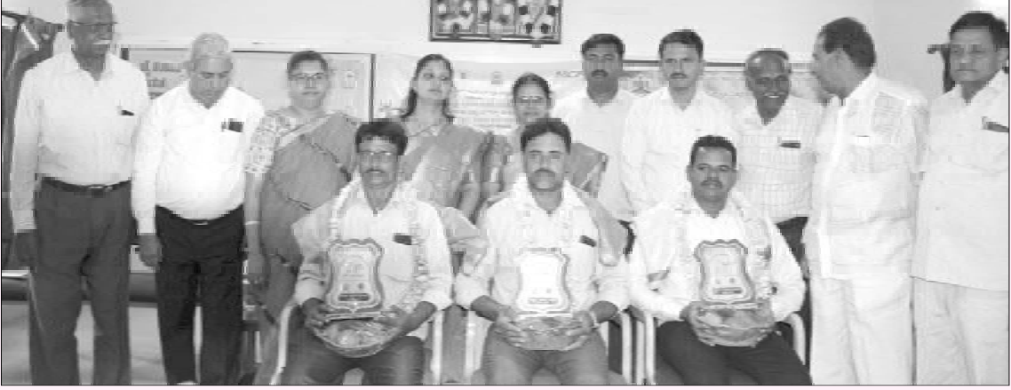
ಸುತ್ತೂರು ಕೆವಿಕೆಯಲ್ಲಿ ರೈತ ದಿನಾಚರಣೆಯಂದು ಪ್ರಗತಿಪರ ರೈತರುಗಳನ್ನು ಸನ್ಮಾನಿಸಲಾಯಿತು

ಸುತ್ತೂರು ಐಸಿಎಆರ್ ಜೆಎಸ್‌ಎಸ್ ಕೃಷಿ ವಿಜ್ಞಾನ ಕೇಂದ್ರದಲ್ಲಿ ಮೈಸೂರಿನ ಅಚ್ಚುಕಟ್ಟು ಅಭಿವೃದ್ಧಿ ಪ್ರಾಧಿಕಾರ ಕಾವೇರಿ ಜಲಾನಯನ ಯೋಜನೆಗಳು, ಪಶುಪಾಲನಾ ಮತ್ತು ಪಶುವೈದ್ಯಕೀಯ ಸೇವಾ ಇಲಾಖೆ ಹಾಗೂ ಹಾಸನದ ಮಂಗಳೂರು ಕೆಮಿಕಲ್ಸ್ ಆಂಡ್ ಫರ್ಟಿಲೈಸರ್ ಇವರುಗಳ ಸಂಯುಕ್ತ ಆಶ್ರಯದಲ್ಲಿ ರೈತ ದಿನಾಚರಣೆಯನ್ನು ದಿನಾಂಕ 23.12.2022ರಂದು ಆಚರಿಸಲಾಯಿತು.