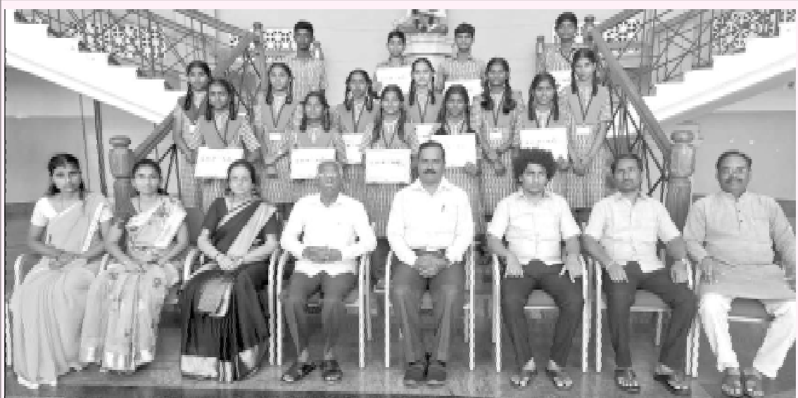
ನಂಜನಗೂಡಿನ ಶಾಲಾ ಶಿಕ್ಷಣ ಮತ್ತು ಸಾಕ್ಷರತಾ ಇಲಾಖೆಯ ವತಿಯಿಂದ ಏರ್ಪಡಿಸಿದ್ದ ತಾಲ್ಲೂಕು ಮಟ್ಟದ ಕಲೋತ್ಸವದ ವಿವಿಧ ಸ್ಪರ್ಧೆಗಳಲ್ಲಿ ಭಾಗವಹಿಸಿ ವಿಜೇತರಾಗಿ ಜಿಲ್ಲಾ ಮಟ್ಟಕ್ಕೆ ಆಯ್ಕೆಯಾದ ಸುತ್ತೂರು ಜೆಎಸ್‌ಎಸ್ ಪ್ರೌಢಶಾಲೆಯ ವಿದ್ಯಾರ್ಥಿಗಳೊಂದಿಗೆ ಮುಖ್ಯೋಪಾಧ್ಯಾಯರು ಹಾಗೂ ತರಬೇತಿ ನೀಡಿದ ಶಿಕ್ಷಕರು