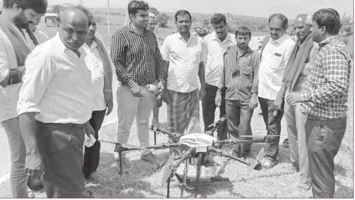
ಕೃಷಿಯಲ್ಲಿ ಡ್ರೋನ್ ಬಳಕೆ ಕುರಿತು ರೈತರಿಗೆ ಮಾಹಿತಿ ನೀಡುತ್ತಿರುವುದು

ಡ್ರೋನ್ ಬಳಕೆಯ ಕುರಿತು ರೈತರಿಗೆ ಮನದಟ್ಟು ಮಾಡಲಾಯಿತು. ಒಂದು ಎಕರೆಗೆ ರೂ. 650ರಂತೆ ಬಾಡಿಗೆ ಹಾಗೂ ಕನಿಷ್ಠ ಒಂದು ಕಡೆ 3 ರಿಂದ 4 ಎಕರೆಯಂತೆ ಒಟ್ಟು 50 ಎಕರೆವರೆಗೆ ಒಂದು ದಿನದಲ್ಲಿ ಸಿಂಪಡಣೆ ಮಾಡಬಹುದು. ಡ್ರೋನ್‌ನಿಂದ ಸಿಂಪಡಣೆ ಮಾಡಲು 1 ಎಕರೆಗೆ 10 ನಿಮಿಷ ಹಾಗೂ 140 ಮಿಲಿ ಔಷಧಿ ಸಾಕು. ಔಷಧಿಯು ನ್ಯಾನೋ ಪಾರ್ಟಿಕಲ್ಸ್ ಆಗಿ ವಿಭಜನೆಗೊಂಡು ಗಿಡದ ಮೇಲೆ ಬೀಳುವುದರಿಂದ ಔಷಧಿ ಉಪಯೋಗದ ಮಟ್ಟ ಹೆಚ್ಚುತ್ತದೆ ಎಂದು ತಿಳಿಸಿದರು. 10 ಲೀಟರ್ ಔಷಧಿಯ ತೂಕದ ಟ್ಯಾಂಕ್ ಹಾಗೂ