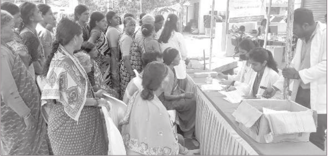
ದೊಡ್ಡಮಾರಗೌಡನಹಳ್ಳಿಯಲ್ಲಿ ಆಯೋಜಿಸಲಾಗಿದ್ದ ಉಚಿತ ಆರೋಗ್ಯ ತಪಾಸಣಾ ಶಿಬಿರ

ಮೈಸೂರಿನ ಜೆಎಸ್‌ಎಸ್ ಆಯುರ್ವೇದ ವೈದ್ಯಕೀಯ ಕಾಲೇಜು ಮತ್ತು ಆಸ್ಪತ್ರೆಯ ಶಲ್ಯತಂತ್ರ ವಿಭಾಗದ ವತಿಯಿಂದ ಉಚಿತ ಆರೋಗ್ಯ ತಪಾಸಣಾ ಶಿಬಿರವನ್ನು ದೊಡ್ಡಮಾರಗೌಡನಹಳ್ಳಿಯ ಶ್ರೀನಿವಾಸ್ ಮೆಡಿಕಲ್ ಮತ್ತು ಕ್ಲಿನಿಕ್ ಸಹಭಾಗಿತ್ವದೊಂದಿಗೆ ದಿನಾಂಕ 24.9.2022ರಂದು ಹಮ್ಮಿಕೊಳ್ಳಲಾಗಿತ್ತು.