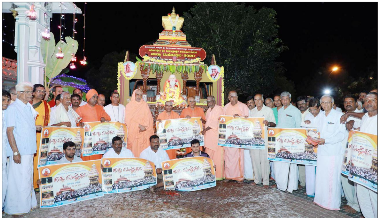
ಜಾತ್ರಾ ಮಹೋತ್ಸವದ ಪ್ರಚಾರ ರಥಕ್ಕೆ ಚಾಲನೆ ನೀಡಿದ ಸಂದರ್ಭ: ಜಗದ್ಗುರುಗಳವರು, ವಿವಿಧ ಮತಗಳ ಶ್ರೀಗಳು, ಸಮಿತಿಗಳ ಸಂಚಾಲಕರು ಹಾಗೂ ಸದಸ್ಯರುಗಳಿದ್ದಾರೆ.