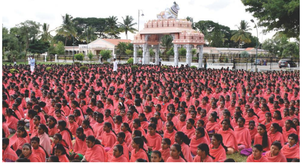
ಗದ್ದುಗೆಯ ಆವರಣದಲ್ಲಿ ವಿದ್ಯಾರ್ಥಿಗಳಿಂದ ಸಾಮೂಹಿಕ ಪ್ರಾರ್ಥನೆ