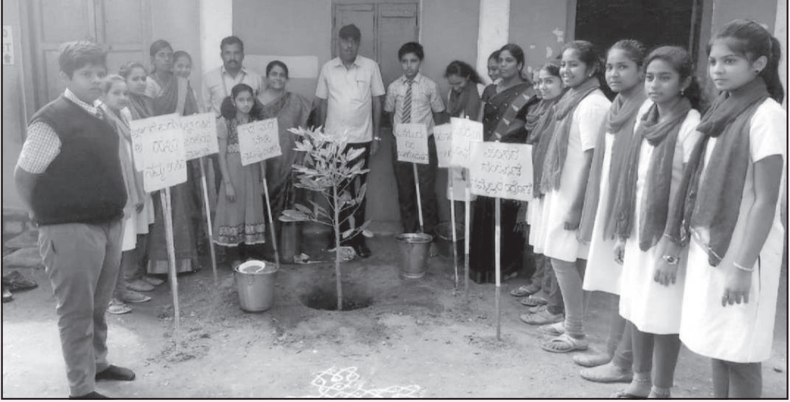
ಮೈಸೂರಿನ ರಾಮಾನುಜ ರಸ್ತೆಯಲ್ಲಿರುವ ಜೆಎಸ್‌ಎಸ್ ಪ್ರೌಢಶಾಲೆಯಲ್ಲಿ ಪರಿಸರ ದಿನಾಚರಣೆ