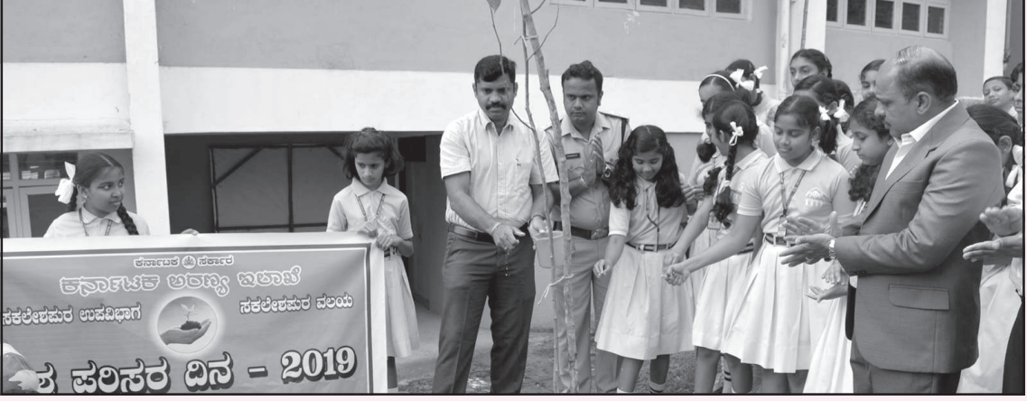
ಬಾಗೆಯ ಜೆಎಸ್‌ಎಸ್ ಪಬ್ಲಿಕ್ ಶಾಲೆಯಲ್ಲಿ ಪರಿಸರ ದಿನಾಚರಣೆ