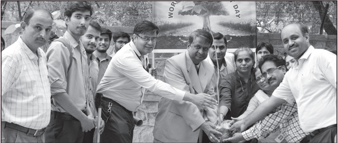
ನೋಯಿಡದಲ್ಲಿರುವ ಜೆಎಸ್‌ಎಸ್‌ಎಚ್‌ಇಯಲ್ಲಿ ಪರಿಸರ ದಿನಾಚರಣೆ

ಕಾರ್ಯಕ್ರಮದ ನಡುವೆ ಸಾಂಸ್ಕೃತಿಕ ಕಾರ್ಯಕ್ರಮಗಳು ಜರುಗಿದವು.