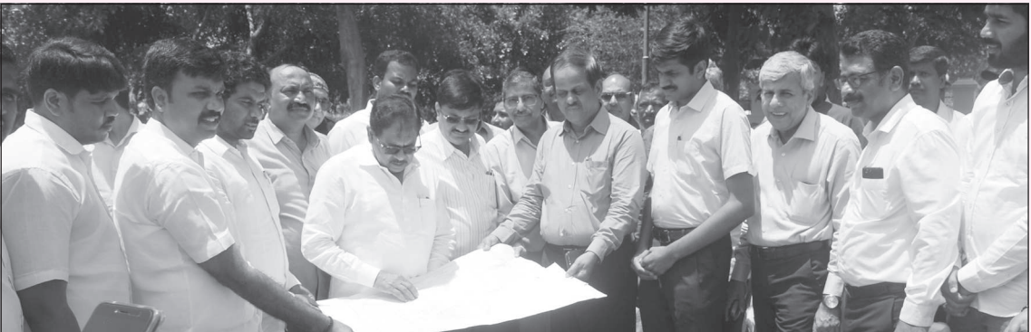
ಸುತ್ತೂರಿಗೆ ಭೇಟಿ ನೀಡಿದ ಉಪಮುಖ್ಯಮಂತ್ರಿಗಳಾದ ಡಾ. ಜಿ. ಪರಮೇಶ್ವರ್‌ರವರು ಸೈನ್ಸ್ ಸಿಟಿ ನಿರ್ಮಾಣ ಸಂಬಂಧ ಸ್ಥಳ ಪರಿಶೀಲಿಸಿದರು

ಈ ಪ್ರಸ್ತಾವನೆಯನ್ನು ಕೇಂದ್ರ ಸರ್ಕಾರಕ್ಕೆ ಸಲ್ಲಿಸಲಿದ್ದು ಅನುಮತಿ ದೊರೆಯುತ್ತಿದ್ದಂತೆ ಕೆಲಸ ಆರಂಭಿಸಲಾಗುವುದು. ಈ ಯೋಜನೆಯನ್ನು 5 ವರ್ಷದಲ್ಲಿ ಮುಗಿಸಬೇಕು ಎಂದು ಸಮಯ ನಿಗದಿಯಾಗಿದೆ. ಆದರೆ ಕೇವಲ ಎರಡು ವರ್ಷದಲ್ಲಿಯೇ ಕೆಲಸ ಮುಗಿಸಲಾಗುವುದು. ಶಾಲಾವುಕ್ಕಳಿಗೆ ಬಾಲ್ಯದಿಂದಲೇ ವಿಜ್ಞಾನ ಮತ್ತು ತಂತ್ರಜ್ಞಾನದ ಬಗ್ಗೆ ಮಾಹಿತಿ ನೀಡುವುದಕ್ಕಾಗಿ ಇಲ್ಲಿ ವಿಜ್ಞಾನಕ್ಕೆ ಸಂಬಂಧಿಸಿದ ಎಲ್ಲಾ ರೀತಿಯ ಮಾದರಿಗಳನ್ನು ಇಡಲಾಗುವುದು. ಅಂತೆಯೇ ಉಪನ್ಯಾಸ ಕಾರ್ಯಕ್ರಮಗಳು ನಡೆಯಲಿವೆ ಎಂದು ಹೇಳಿದರು.