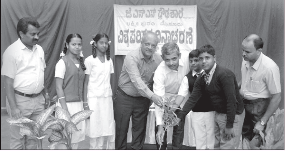
ಮೈಸೂರಿನ ಲಕ್ಷ್ಮೀಪುರಂನಲ್ಲಿರುವ ಜೆಎಸ್‌ಎಸ್ ಪ್ರೌಢಶಾಲೆಯಲ್ಲಿ ಪರಿಸರ ದಿನಾಚರಣೆ