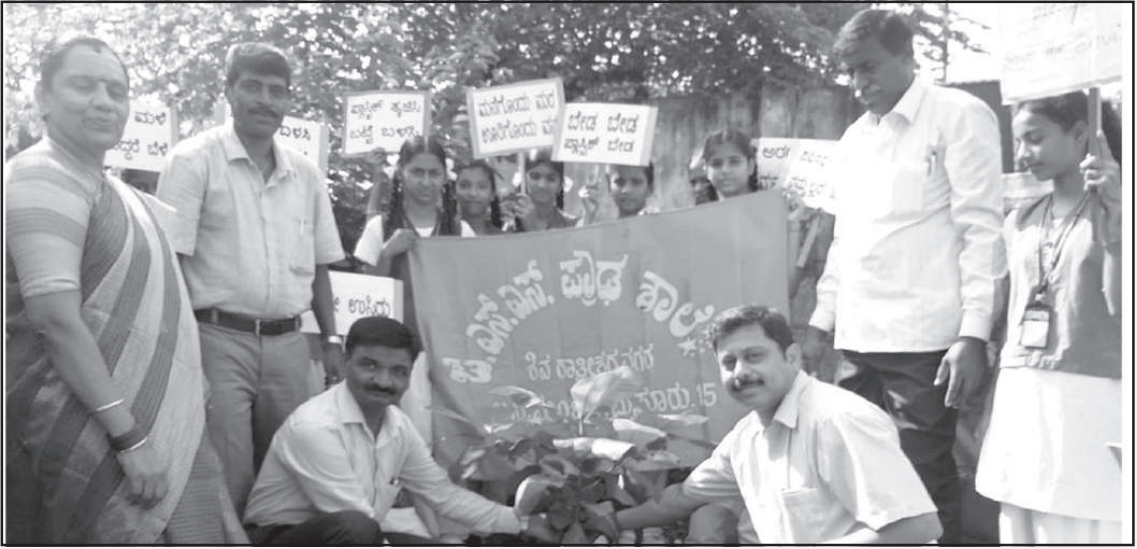
ಮೈಸೂರಿನ ಶ್ರೀ ಶಿವರಾತ್ರೀಶ್ವರ ನಗರದ ಜೆಎಸ್‌ಎಸ್ ಪ್ರೌಢಶಾಲೆಯಲ್ಲಿ ಪರಿಸರ ದಿನಾಚರಣೆ

ಉಳಿಸಿ, ಮನೆಗೊಂದು ಮರ ಊರಿಗೊಂದು ವನ, ಪರಿಸರ ಸಂರಕ್ಷಣೆ ನಮ್ಮೆಲ್ಲರ ಹೊಣೆ, ಮುಂತಾದ ಘೋಷಣೆಗಳನ್ನು ವೊಳಗಿಸಿದರು. ಶಾಲಾ ಬ್ಯಾಂಡ್‌ನೊಂದಿಗೆ ವಿದ್ಯಾರ್ಥಿಗಳು ಫಲಕಗಳನ್ನಿಡಿದು ಬನ್ನಿಮಂಟಪ, ಹುಡ್ಕೋ ಹಾಗೂ ಕಾವೇರಿ ನಗರ