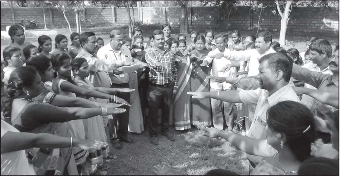
ಜೆಎಸ್‌ಎಸ್ ರುಡ್‌ಸೆಟ್ ಸಂಸ್ಥೆಯಲ್ಲಿ ಪರಿಸರ ದಿನಾಚರಣೆ