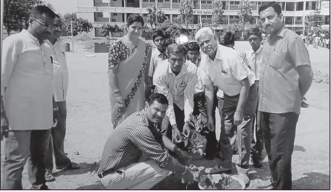
ಕೋಲಾರ ಜಿಲ್ಲೆಯ ಮಾಲೂರಿನಲ್ಲಿರುವ ಜೆಎಸ್‌ಎಸ್ ಗಾಯತ್ರಿ ಪ್ರೌಢಶಾಲೆಯಲ್ಲಿ ಪರಿಸರ ದಿನಾಚರಣೆ