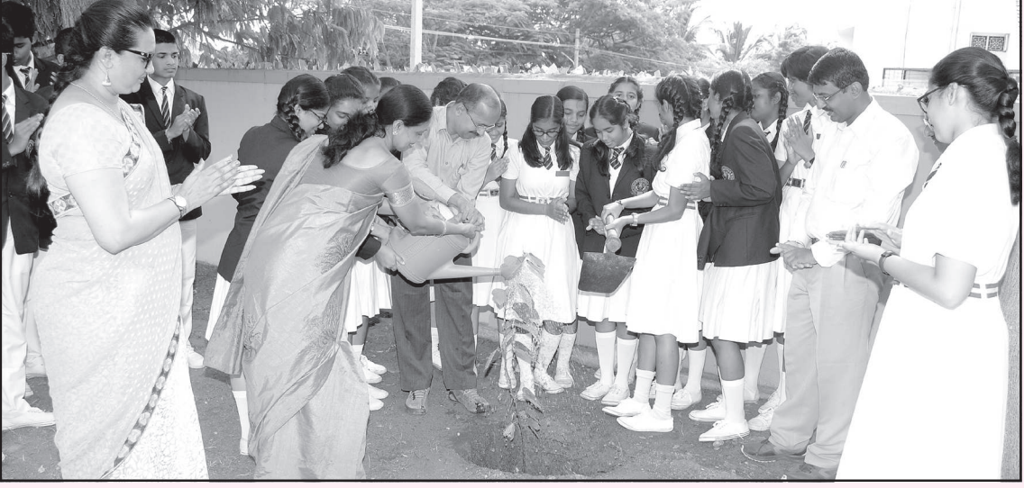
ಮೈಸೂರಿನ ಸಿದ್ಧಾರ್ಥನಗರದ ಜೆಎಸ್‌ಎಸ್ ಪಬ್ಲಿಕ್ ಶಾಲೆಯಲ್ಲಿ ಪರಿಸರ ದಿನಾಚರಣೆ