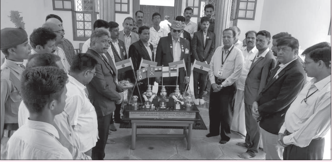
'ಶ್ರದ್ಧಾ ಸುಮನ್ ಶ್ರದ್ಧಾಂಜಲಿ ಕಳಶ್' ಯಾತ್ರೆಯು ಮೈಸೂರಿನ ಸುತ್ತೂರು ಶ್ರೀಮಠಕ್ಕೆ ಆಗಮಿಸಿದ ಸಂದರ್ಭ