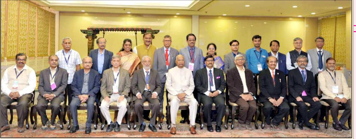
ಮೈಸೂರು ಮತ್ತು ಊಟಿಯ ಜೆಎಸ್‌ಎಸ್ ಔಷಧ ವಿಜ್ಞಾನ ಕಾಲೇಜುಗಳು ರಾಷ್ಟ್ರೀಯ ರ್ಯಾಂಕಿಂಗ್ ಪಟ್ಟಿಯಲ್ಲಿ 8 ಮತ್ತು 10ನೇ ಸ್ಥಾನ ಪಡೆದ ಪ್ರಯುಕ್ತ ನವದೆಹಲಿಯ ವಿಜ್ಞಾನ ಭವನದಲ್ಲಿ ಜರುಗಿದ ಪ್ರಶಸ್ತಿಪ್ರದಾನ ಸಮಾರಂಭದ ಸಂದರ್ಭದಲ್ಲಿ ರಾಷ್ಟ್ರಪತಿಗಳಾದ ಶ್ರೀ ರಾಮನಾಥ್ ಕೋವಿಂದ ಅವರೊಂದಿಗೆ ಜೆಎಸ್‌ಎಸ್ ಮಹಾವಿದ್ಯಾಪೀಠದ ಕಾರ್ಯನಿರ್ವಾಹಕ ಕಾರ್ಯದರ್ಶಿಗಳಾದ ಡಾ. ಸಿ.ಬಿ. ಬೆಟಸೂರಮರ ಹಾಗೂ ಇತರೆ ಅತಿಥಿಗಳು