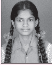
ಪಿ. ನಿಸರ್ಗ 580