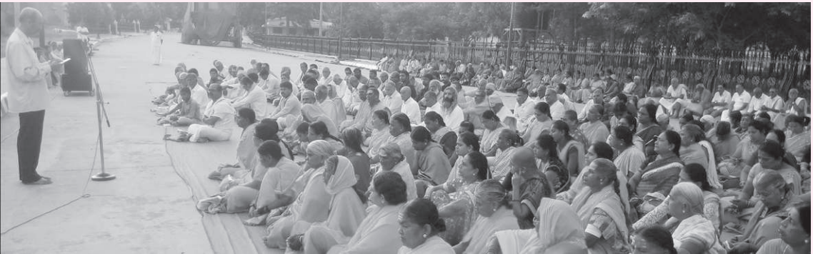
ಚಿಂತನ-ಮಂಥನದಲ್ಲಿ ಪಾಲ್ಗೊಂಡಿದ್ದ ಆಧ್ಯಾತ್ಮಿಕ ಜಿಜ್ಞಾಸುಗಳು

ಸಂಗ್ರಹಿಸುವುದು, ತಯಾರಿಸುವುದು, ಭಾಗವಹಿಸುವುದು, ಕಲಾನ್ವೇಷಣೆ, ಪ್ರದರ್ಶನ ಮತ್ತು ಆಟೋಟಿಗಲಾಗಿ ಹವ್ಯಾಸಗಳನ್ನು ವಿಂಗಡಿಸಬಹುದು. ನಮ್ಮ ದಿನಚರಿ ನೋಡಿದರೆ ತಿಳಿಯುತ್ತದೆ ಯಾವ ಯಾವ ಹವ್ಯಾಸಗಳು ಮೈಗೂಡಿವೆ ಎಂದು. ಉತ್ತಮ ಹವ್ಯಾಸಗಳು ಆರೋಗ್ಯದಾಯಕ. ಆಧ್ಯಾತ್ಮಿಕ ಸಾಧಕರ ಹವ್ಯಾಸಗಳೆಂದರೆ ಸತ್ಸಂಗದಲ್ಲಿ ತೊಡಗುವುದು, ಸ್ವಾಧ್ಯಾಯ, ಪ್ರವಚನಗಳಲ್ಲಿ ಭಾಗವಹಿಸುವುದು ಮತ್ತು ಆಲಿಸುವುದು, ಯೋಗಾಭ್ಯಾಸ, ಧ್ಯಾನ, ಲೇಖನಗಳನ್ನು ಬರೆದು ಪ್ರಕಟಿಸುವುದು, ಪ್ರವಾಸ, ತೀರ್ಥಯಾತ್ರೆ, ಧನಾತ್ಮಕ ಚರ್ಚೆಗಳಲ್ಲಿ ಭಾಗವಹಿಸುವುದು ಇನ್ನೂ ಮುಂತಾದವುಗಳು ಒಳ್ಳೆಯ ಹವ್ಯಾಸಗಳಾಗಿವೆ. ತತ್ವಜ್ಞಾನಿ ಬರ್ತ್ರಾಂಡ್ ರಸೆಲ್‌ರವರು ಹೇಳುವಂತೆ ಉತ್ತಮ ಹವ್ಯಾಸಗಳಿದ್ದರೆ ಜೀವನದಲ್ಲಿ ಸಂತೋಷಪಡಲು ಮತ್ತು ಸಂಭ್ರಮಿಸಲು ಅವಕಾಶಗಳಿವೆ ಎಂದು ಉದಾಹರಣೆಗಳ ಮೂಲಕ ತಿಳಿಸಿದರು.