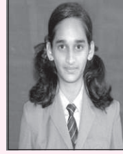
ವಿಮರ್ಶ ಎನ್ ಬೆಳ್ಳೂರ್ 91.8%