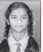
ಎಸ್.ಎನ್. ಸಿಂಚೆನ್ 504