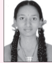
ಆರ್. ಮಾನಸ 526