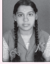
ಡಿ.ಎನ್. ನಮ್ರತ 606