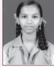
ಎಂ.ಎಸ್. ಏಕತಾ 574