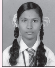
ಎಚ್.ಎಸ್. ಸಂಗೀತ 521