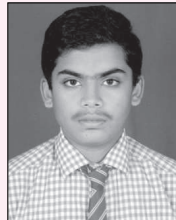
ಎಸ್.ಆರ್. ಅನ್ವೇಶ್ 508