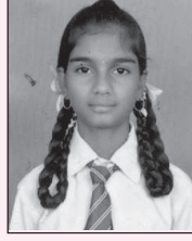
ಎಸ್. ಸುಮ 569

2018-19 ನೇ ಸಾಲಿನ ಎಸ್‌ಎಸ್‌ಎಲ್‌ಸಿ ಪರೀಕ್ಷೆಯಲ್ಲಿ ಅತಿ ಹೆಚ್ಚು ಅಂಕ ಪಡೆದ ಹನೂರು ತಾಲ್ಲೂಕಿನ ಬಂಡಳ್ಳಿ ಜೆಎಸ್‌ಎಸ್ ಪ್ರೌಢಶಾಲೆ ವಿದ್ಯಾರ್ಥಿಗಳು