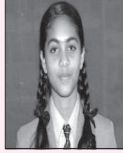
ಎನ್.ಎಸ್. ಮೌಲ್ಯ 92.8%