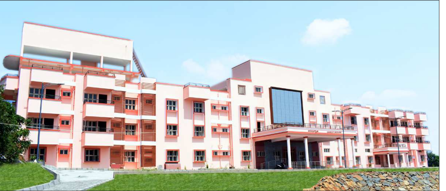
ಶ್ರೀ ಮಲೆ ಮಹದೇಶ್ವರ ಬೆಟ್ಟದಲ್ಲಿ ನಿರ್ಮಿತವಾಗಿರುವ ಶ್ರೀ ಸುತ್ತೂರು ಮಠದ ಅತಿಥಿಗೃಹದ ಒಂದು ನೋಟ