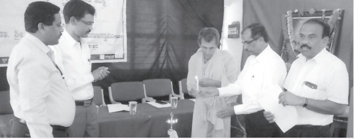
ಮರಿಯಾಲದ ಜೆಎಸ್‌ಎಸ್ ಕೈಗಾರಿಕಾ ತರಬೇತಿ ಸಂಸ್ಥೆ ಮತ್ತು ಜೆಎಸ್‌ಎಸ್ ಗ್ರಾಮೀಣಾಭಿವೃದ್ಧಿ ಹಾಗೂ ಸ್ವ ಉದ್ಯೋಗ ತರಬೇತಿ ಸಂಸ್ಥೆಗಳ ಆಶ್ರಯದಲ್ಲಿ ನಡೆದ ಪೂಜ್ಯ ರಾಜೇಂದ್ರ ಶ್ರೀಗಳವರ ಜಯಂತಿ ಮಹೋತ್ಸವದಲ್ಲಿ ಗಣ್ಯರು ಜ್ಯೋತಿ ಬೆಳಗಿಸುತ್ತಿರುವುದು

ಆದರೆ ದಾರ್ಶನಿಕರ ಜಯಂತಿಯನ್ನು ಪೂಜ್ಯ ಭಾವದಿಂದ ಆಚರಿಸುತ್ತಾರೆ. ಅಂತಹ ದಾರ್ಶನಿಕರಲ್ಲಿ ಪರಮಪೂಜ್ಯ ರಾಜೇಂದ್ರ ಶ್ರೀಗಳವರು ಒಬ್ಬರು. ಚಾಮರಾಜನಗರ ಜಿಲ್ಲೆ ಎಂದರೆ ಶ್ರೀಗಳವರಿಗೆ ಅಪಾರ ಒಲವು. ಹಿಂದುಳಿದ ಪ್ರದೇಶವನ್ನು ಗುರುತಿಸಿ ಪ್ರಸಾದದ ಜೊತೆಗೆ ಶೈಕ್ಷಣಿಕ ಸಂಸ್ಥೆಗಳನ್ನು ಪ್ರಾರಂಭಿಸುವುದರೊಂದಿಗೆ ಜ್ಞಾನದ ದೀವಿಗೆಯನ್ನು ನೀಡಿದವರು. ಅವರು ತುಳಿದ ನೆಲವೆಲ್ಲ ಪಾವನ ಕ್ಷೇತ್ರವಾಗಿದೆ. ಮುಟ್ಟಿದಂತಹ ನೀರು ತೀರ್ಥವಾಗಿದೆ. ರಾಷ್ಟ್ರಕವಿ ಕುವೆಂಪುರವರು ರಾಮಕೃಷ್ಣ ಪರಮಹಂಸ ಮಠವನ್ನು ಬಿಟ್ಟರೆ ಇನ್ನಾವುದೇ ಮಠಕ್ಕೆ ಹೋದವರಲ್ಲ. ಆದರೆ ರಾಜೇಂದ್ರ ಶ್ರೀಗಳವರ ಅಮೃತ ಮಹೋತ್ಸವದಲ್ಲಿ ಹೊರತಂದ "ಅರ್ಚನ" ಎಂಬ ಗ್ರಂಥಕ್ಕೆ ಮುನ್ನುಡಿಯನ್ನು ಬರೆಯುತ್ತಾರೆ.