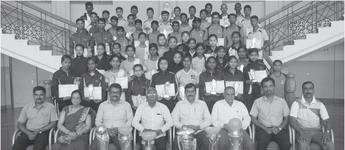
ವಿಜೇತ ವಿದ್ಯಾರ್ಥಿಗಳೊಂದಿಗೆ ಸಂಸ್ಥೆಯ ಮುಖ್ಯಸ್ಥರು ಮತ್ತು ಅಧ್ಯಾಪಕರು