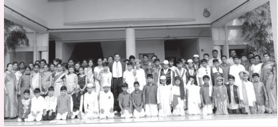
Students in their Ethnic Dress

wearers for each class and also for staff and teachers. The participants stole the show with their traditional wear and ethnic jewellery.