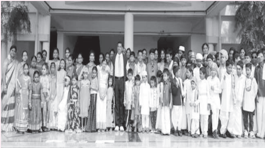
Students in their Ethnic Dress

Ethnicity plays a major role in how students' personality is shaped when the little ones were provided with an opportunity to celebrate the diversity of vibrant and colourful India.