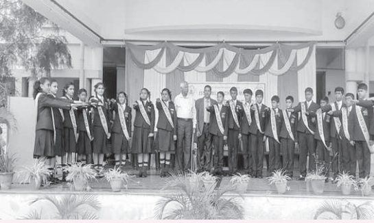
Oath Taking Ceremony of Students

school for providing opportunities to the students to take part in extra-curricular activities. He also congratulated the newly appointed members of the School Council for their preparedness to take up responsibilities.