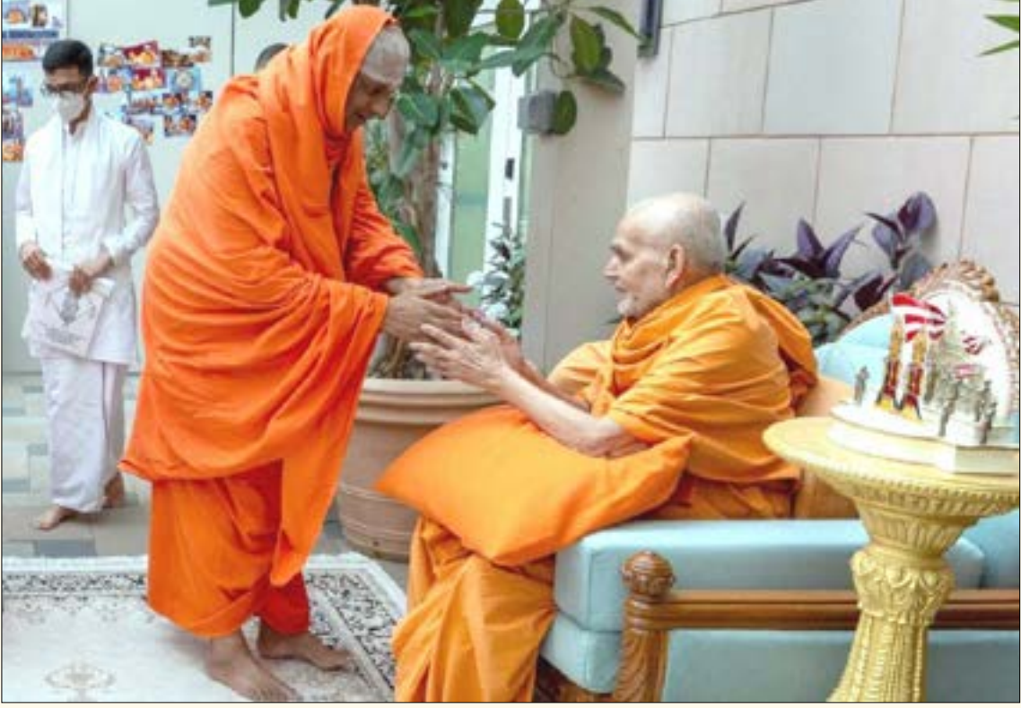
ಅಮೆರಿಕದ ನ್ಯೂಜೆರ್ಸಿಯ ರಾಬಿನ್‌ವಿಲ್ಡ್ ಅಕ್ಷರಧಾಮದ ಉದ್ಘಾಟನೆ ಅಂಗವಾಗಿ ಏರ್ಪಡಿಸಿದ್ದ 'ಸ್ಫೂರ್ತಿ ಉತ್ಸವ'ದಲ್ಲಿ ಪರಮಪೂಜ್ಯ ಜಗದ್ಗುರುಗಳವರು ಭಾಗವಹಿಸಿದ್ದಾಗ ಬ್ಯಾಪ್ಟಿಸ್ಟ್ ಮುಖ್ಯಸ್ಥರಾದ ಶ್ರೀ ಮಹಾಂತ ಸ್ವಾಮಿಗಳವರ ಕುಶಲೋಪರಿ ವಿಚಾರಿಸುತ್ತಿರುವುದು. ಕಿರಿಯ ಶ್ರೀಗಳು ಇದ್ದಾರೆ (8 ಸೆಪ್ಟೆಂಬರ್ 2023)