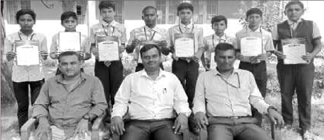
The Volleyball Team of the School won the Second Prize