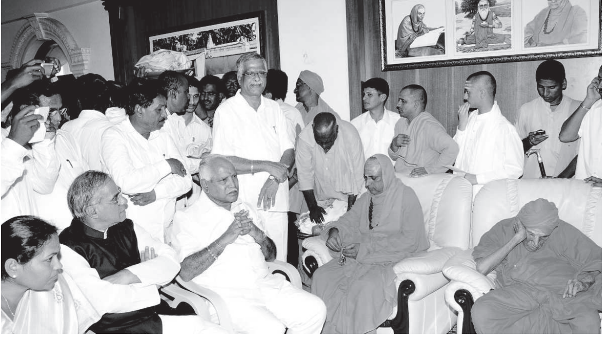
ಸುತ್ತೂರಿನ ಶ್ರೀಮಠದ ಪುನರ್ನಿರ್ಮಿತ ಕಟ್ಟಡದ ಪ್ರವೇಶೋತ್ಸವ ಸಂದರ್ಭದಲ್ಲಿ ಪರಮಪೂಜ್ಯ ಶ್ರೀಗಳು, ಸಿದ್ದಗಂಗಾ ಶ್ರೀಗಳು ಮತ್ತು ಮಾಜಿ ಮುಖ್ಯಮಂತ್ರಿಗಳಾದ ಶ್ರೀ ಯಡಿಯೂರಪ್ಪನವರು ಹಾಗೂ ಮತ್ತಿತರರು