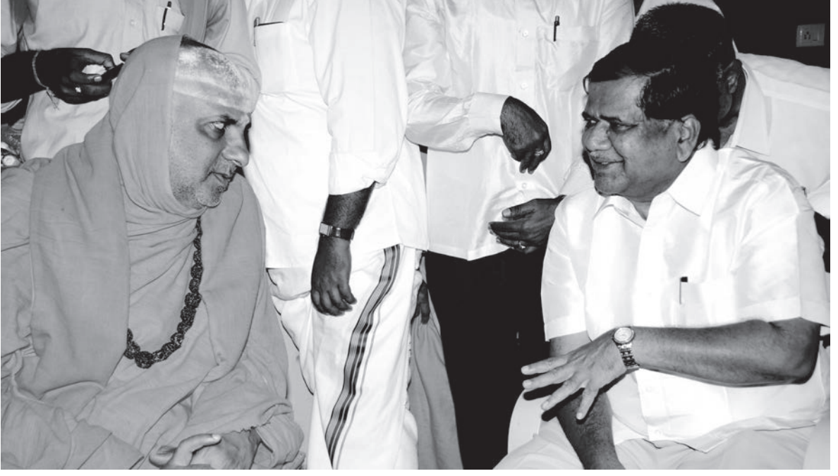
ಸುತ್ತೂರಿನ ಶ್ರೀಮಠದ ಪುನರ್ನಿರ್ಮಿತ ಕಟ್ಟಡದ ಪ್ರವೇಶೋತ್ಸವ ಸಂದರ್ಭದಲ್ಲಿ ಪರಮಪೂಜ್ಯ ಶ್ರೀಗಳವರು ಮತ್ತು ಮಾಜಿ ಮುಖ್ಯಮಂತ್ರಿ ಶ್ರೀ ಜಗದೀಶ ಶೆಟ್ಟರವರು